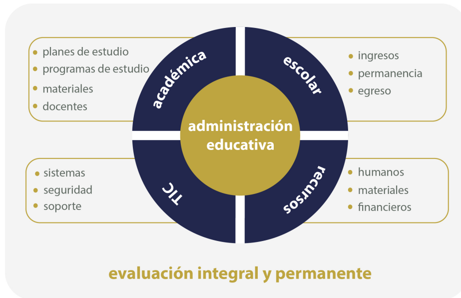
Figura 3. Áreas de la Administración educativa

Para el funcionamiento óptimo del modelo educativo, estas cuatro áreas deben sujetarse a una evaluación permanente de sus procesos y componentes. Ello permitirá contar con un panorama de los avances y desviaciones de las acciones de acuerdo con lo planeado, con lo que se posibilitará que se retroalimente con información necesaria y oportuna para realizar los cambios o adecuaciones pertinentes para una mejor operación que garantice servicios de calidad a quienes tengan acceso a la institución.